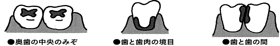
●奥歯の中央のみぞ ●歯と歯肉の境目 ●歯と歯の間

健診では、歯の数(乳歯、永久歯)、歯の状態(むし歯の有無・程度、知覚歯の有無、歯のよぐれ)、歯ぐきの様子、それから、あごや歯並び、かみ合わせなど、沢山の事をみています。 今回、治療の必要のある人には、「口腔健康診断結果のお知らせ」を渡します。 もらった人は、早めに歯科を受診しましょう!!